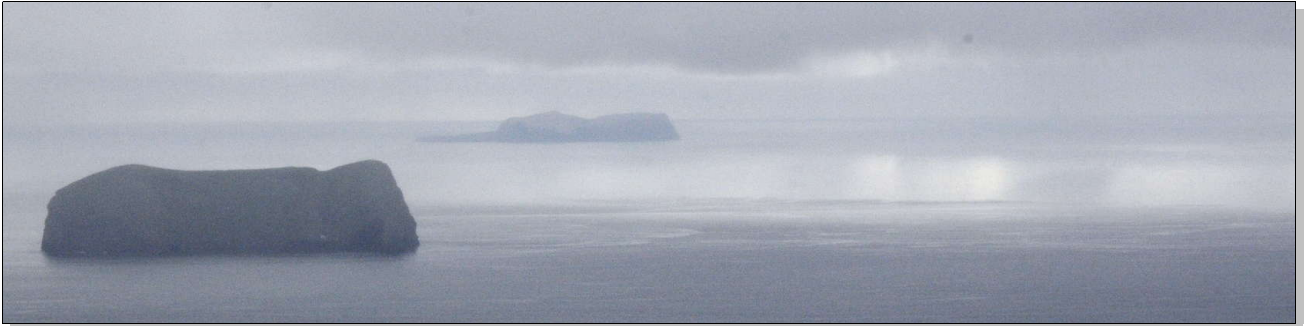
63° nord, pays des tempêtes annoncées au café du port, vu du Heimaklettur (280 m) L'Océan Atlantique, calme comme un miroir, avale les nuages et fait flotter les îles dans le ciel

Tout cela ne me convainc pas de faire un effort de développement personnel pour aiguïser mon esprit, déjà trop critique tel qu'il est, dans le but de mieux filtrer et trier l'information non sollicitée qui m'arrive spontanément par tous les pores. Je préfère faire comme le singe intelligent : ne rien voir et ne rien entendre. Mettre les voiles en solo et partir à la découverte d'endroits que je ne connais pas, à propos desquels je ne m'informe qu'avec des sources d'informations relativement limitées et surtout peu polluées, sans fausses croyances, absentes de jugements de valeur ou d'interprétations fantaisistes et abusives, telles que les cartes marines ou Google Earth. C'est une forme d'aventure à la petite semaine.