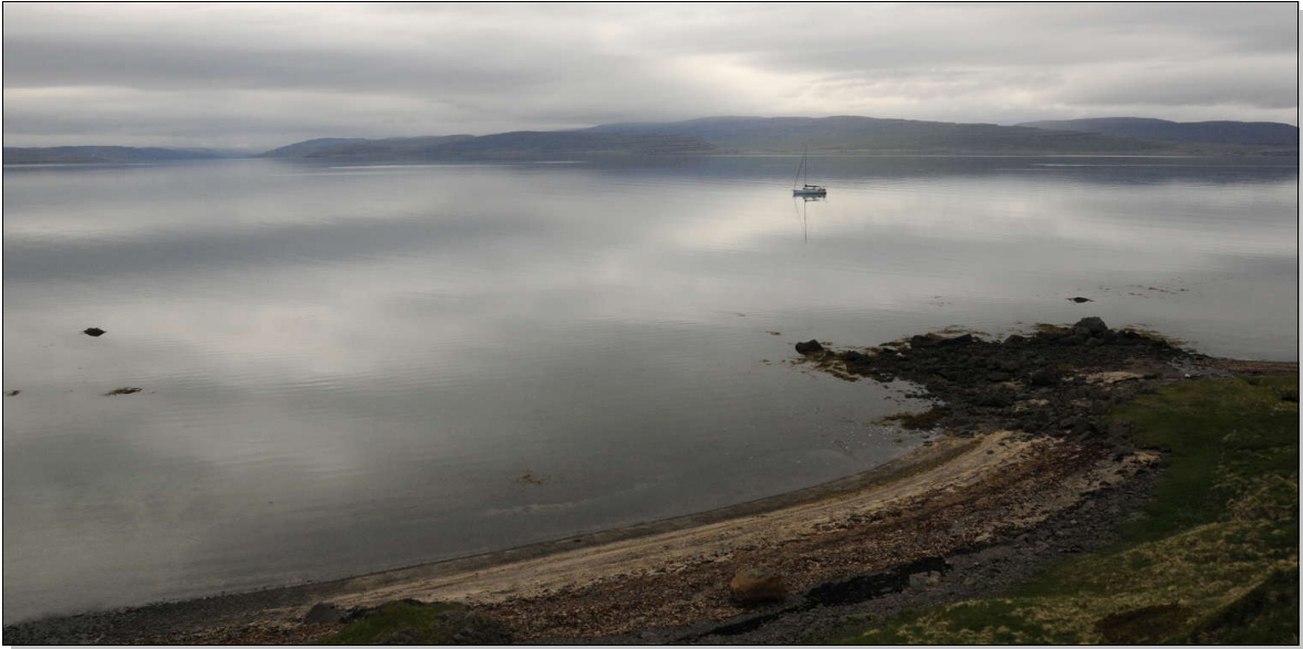
Thoè, à l'ancre dans les nuages