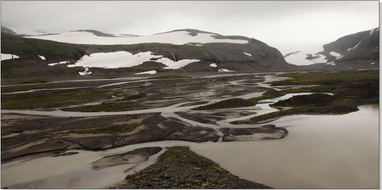
5 heures et le crachin suffiront à amputer le dernier tronçon à parcourir pour toucher le glacier du bout du doigt