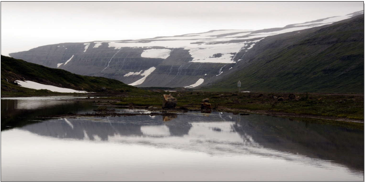
En route vers le Drangajökull