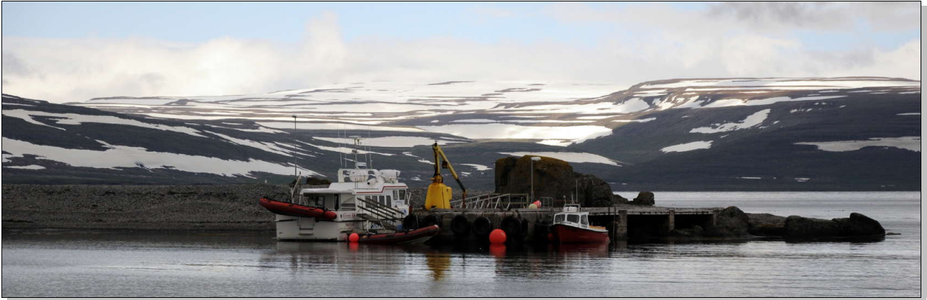
Le petit ponton de Vigur, impraticable pour un voilier. Thoè restera au mouillage.