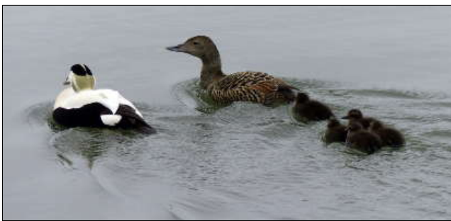
Prolific est mis à terre pour fixer des problèmes de quille et de safran. Les bébés eider sont mis à l'eau par leur parents

Akureyri, 3 juin. C'est le tour de Thoè. La météo grise et pluvieuse est presque aussi pire que celle des 11 novembre belges. Ce n'est pas peu dire ! Une météo d'un pathétique enterrement, alors qu'il s'agit d'un joyeux « en-mer-ement ». Les ouvriers du chantier Slippurinn s'activent avec leurs monstrueux engins, par leur taille et leur capacité. Ici, on fait dans la dentelle des chalutiers usines, pas dans le bateau modèle réduit. Dans la photo de gauche ci-dessus, Prolific va se poser sur une structure monolithique roulant sur le fond sur quatre rails parallèles. Les deux piliers latéraux à l'arrière du ketch et la structure à l'avant font partie d'un même ensemble, tracté vers la terre par des câbles, à une vitesse contrôlée au millimètre par seconde près.