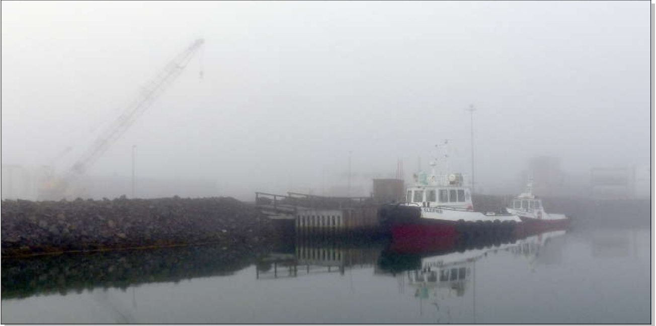
A l'aube. La météo l'a promis, le brouillard va faire place à des éclaircies