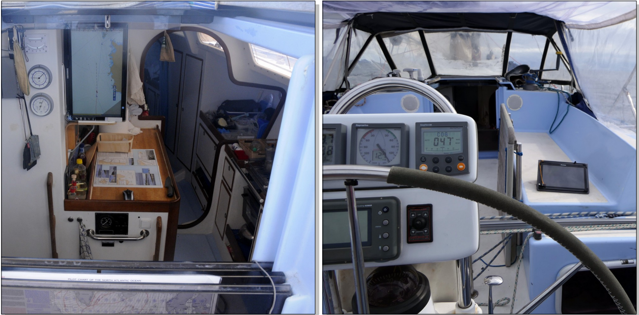
Écran en face de la descente (cartographie OpenCPN)

L'idée a vite surgi. Intégrer la tablette et le PC du bord. Celui-ci est devenu un serveur TCP/IP de données de navigation, via WiFi. La tablette dispose désormais des mêmes données que le PC (réseau Seatalk Raymarine, NMEA et AIS). Tous deux utilisent OpenCPN comme logiciel de navigation. Cette architecture permet de connecter autant d'ordinateurs, de smartphones et de tablettes que l'on veut au PC du bord. Le Smartphone de chaque équipier permet de naviguer en sécurité. Dans le cas où la connexion WiFi ou le PC du bord fait défaut, la cartographie utilise le GPS interne de la tablette ou du smartphone. Dans ce cas, la tablette ne bénéficie pas des données du réseau Seatalk (instruments de navigation) ni d'AIS qui ne sont pas indispensables pour tracer sa route.