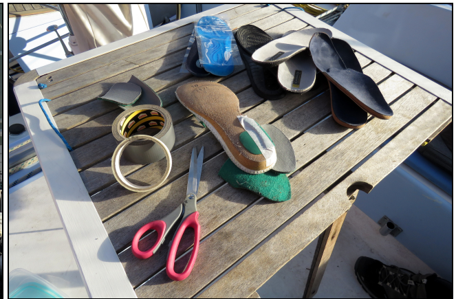
Tournesol a organisé un atelier pour améliorer l'adéquation de mes semelles orthopédiques maison