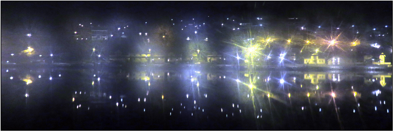
Une nuit on ne peut plus calme